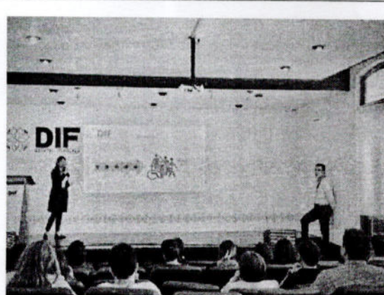
FOTO DE LA PONENTE EN LA PRESENTACION DE TURISMO INCLUSIVO MEDIANTE EQUIPO ADAPTADO