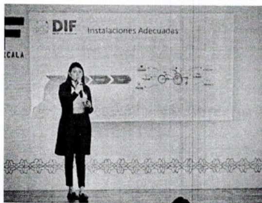
FOTO DE LA PONENTE EN LA PRESENTACION DE TURISMO INCLUSIVO MEDIANTE EQUIPO ADAPTADO