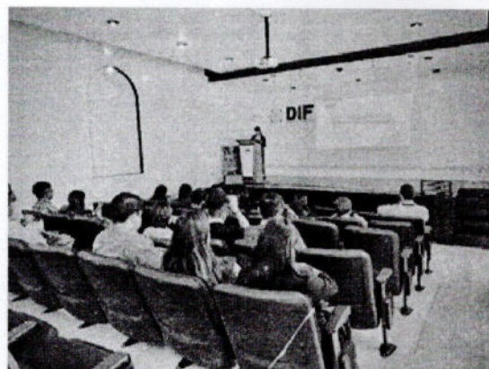
FOTO DE REPRESENTANTES DE LOS DIFERENTES MUNICIPIOS QUE CONFORMA EL ESTADO DE TLAXCALA