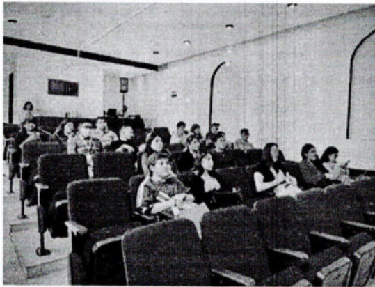
FOTO DE REPRESENTANTES DE LOS DIFERENTES MUNICIPIOS QUE CONFORMA EL ESTADO DE TLAXCALA

MEDIO DE VERIFICACIÓN: REGISTRO DE ASISTENCIA Y EVIDENCIA FOTOGRÁFICA MES: AGOSTO 2023