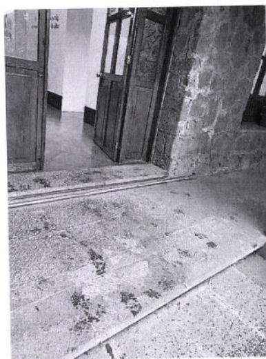
Rampa 1 y 2

Necesidad de instalación en Casa de Día, ubicada en calle Guerrero número 5 en San Pablo Apetatitlán, de Antonio Carvajal, Tlaxcala.