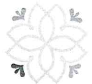
Gráfico 2do Semestre Acciones de Atención