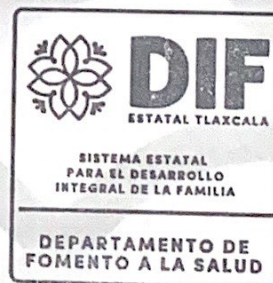
Jefe de Departamento de Fomento a la Salud