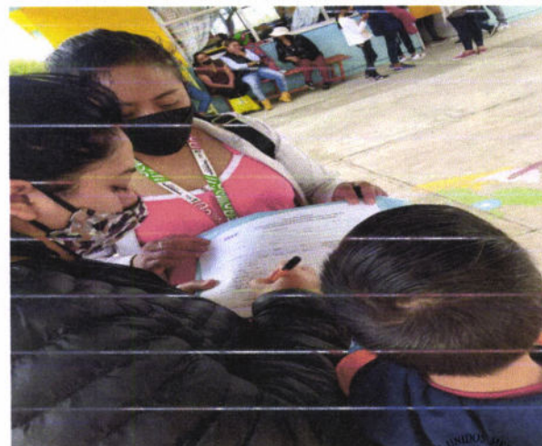
ANEXO 1: EVALUACIONES SECCION 6.