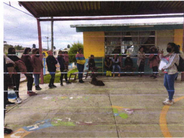
PLATICA: "MENSAJE" BEBIDAS QUE FAVORECEN NUESTRA SALUD (HIDRATACION CORRECTA).